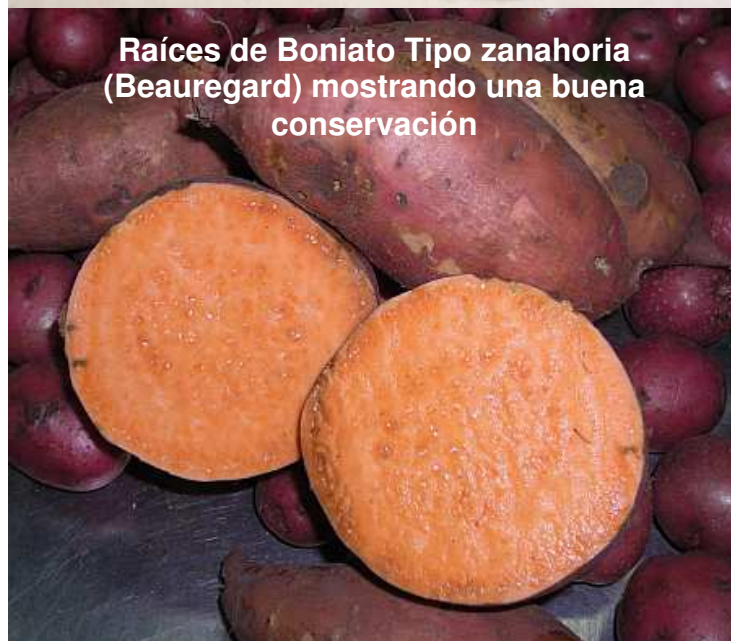
Raíces de Boniato Tipo zanahoria (Beauregard) mostrando una buena conservación

Al igual también que en trabajos anteriores, se verificaron importantes mermas en el peso de las raíces de boniato, especialmente en la variedad Arapey y asociadas con los problemas de ahuecado. Siendo el peso neto de las partidas de Arapey sin problemas de calidad y de las de "tipo zanahoria" de alrededor de 19.0 kg (de 18.8 a 20.8 kg), mientras que las partidas de Arapey con problemas de "ahuecado" apenas pesaban 16 kg (de 14.7 a 18.2 kg).