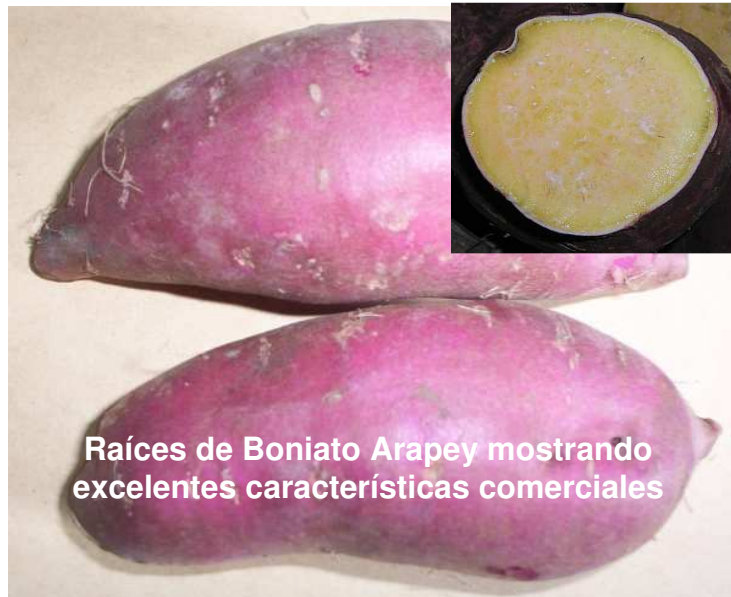
Raíces de Boniato Arapey mostrando excelentes características comerciales