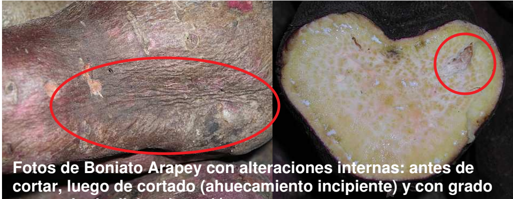
Fotos de Boniato Arapey con alteraciones internas: antes de cortar, luego de cortado (ahuecamiento incipiente) y con grado avanzado de dicha alteración