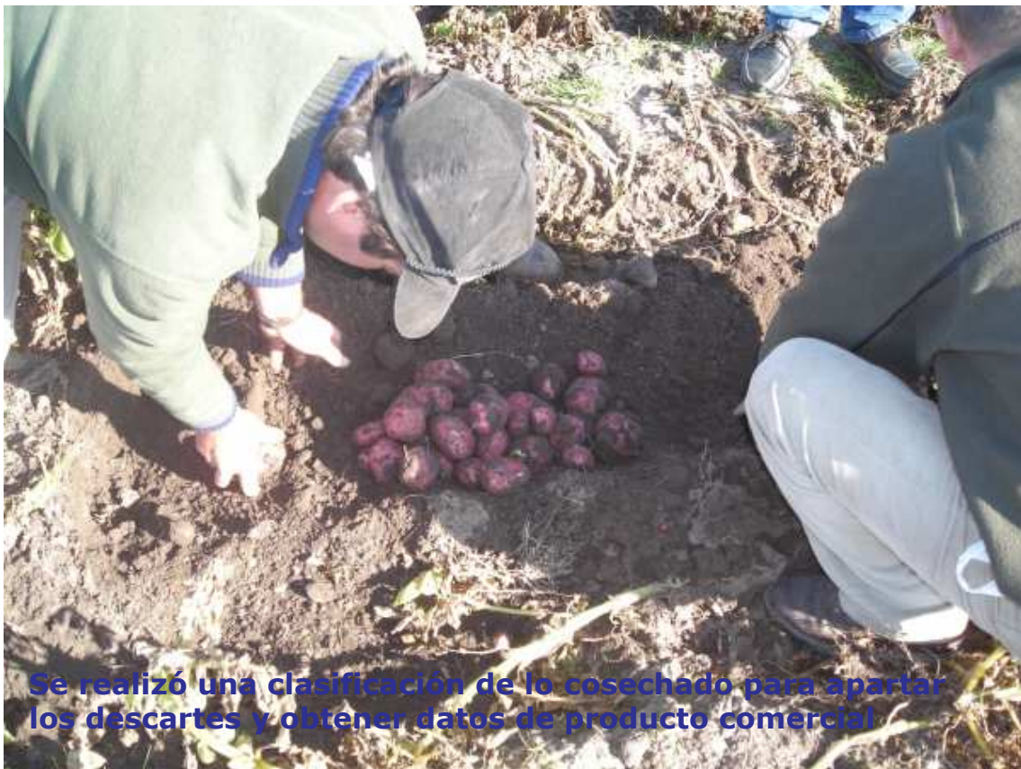
Se realizó una clasificación de lo cosechado para apartar los descartes y obtener datos de producto comercial