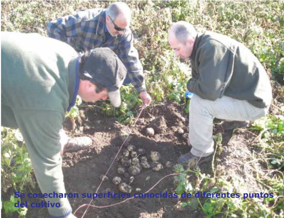
Se cosecharon superficies conocidas de diferentes puntos del cultivo

La secuencia de fotos muestra el procedimiento empleado para las estimaciones de rendimiento en chacra.