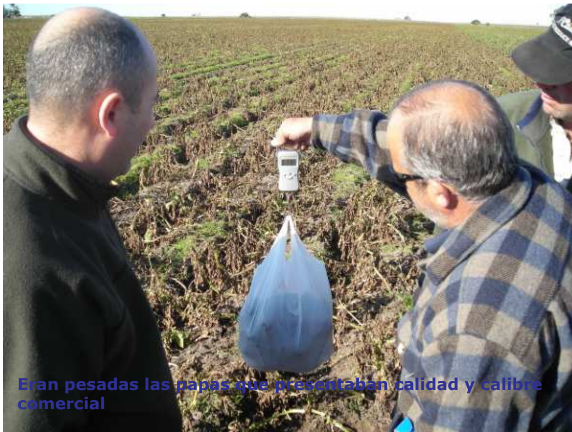
Eran pesadas las papas que presentaban calidad y calibre comercial