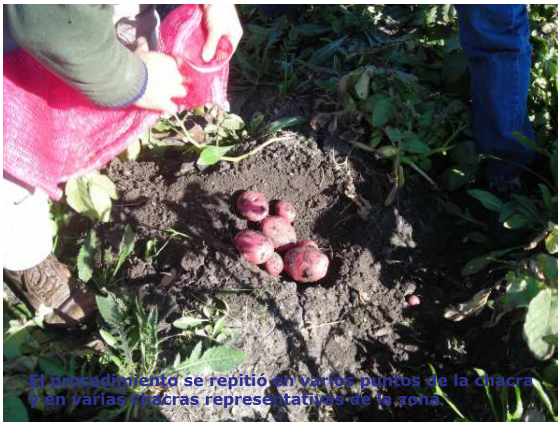
El procedimiento se repitió en varios puntos de la chacra y en varias chacras representativas de la zona