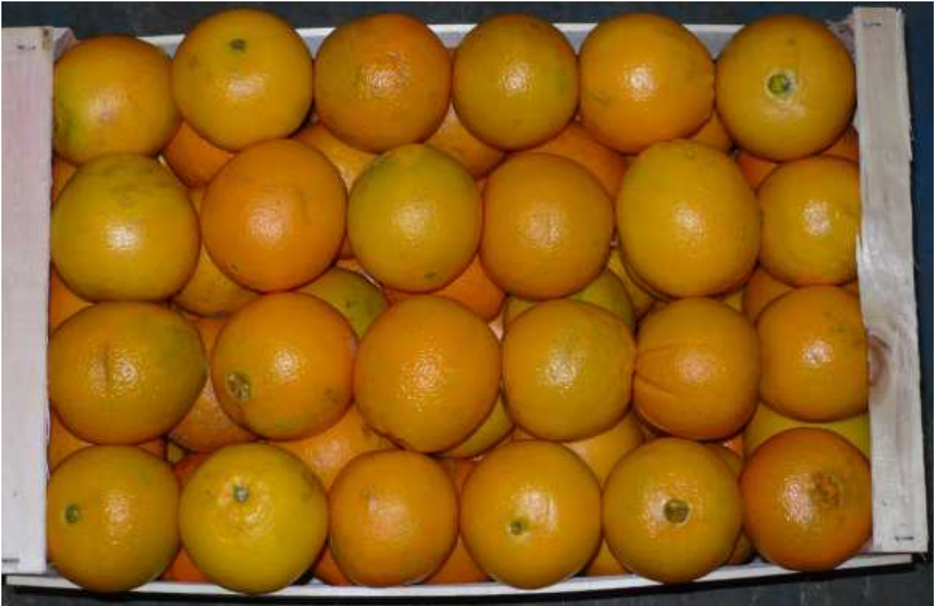
Naranjas del Grupo Navel o "de Ombligo".