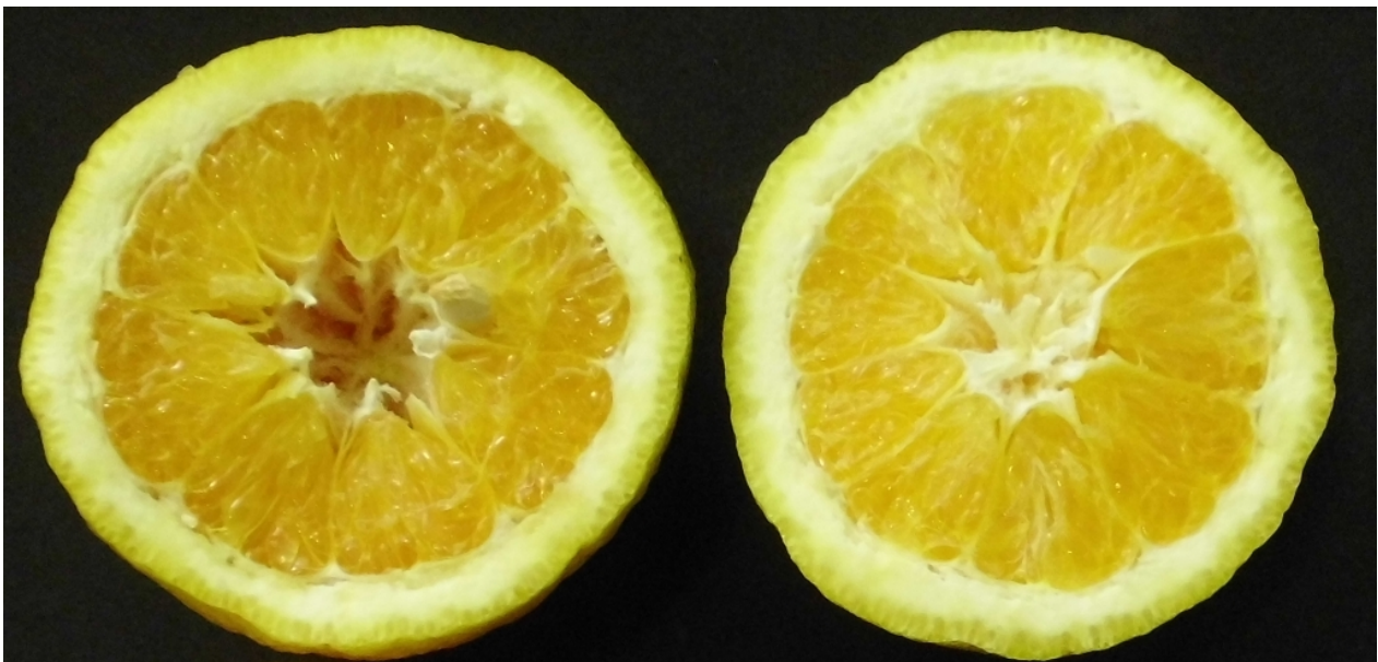
Naranjas Valencia con problemas de calidad.

Por su parte, las naranjas del grupo Navel o de Ombligo , cuya zafra se extiende desde Abril a Septiembre, presentaban al momento del estudio escasos ingresos, comparado con las del grupo Valencia y ventas poco ágiles dada la percepción, por parte de los compradores, de alto grado de inmadurez.