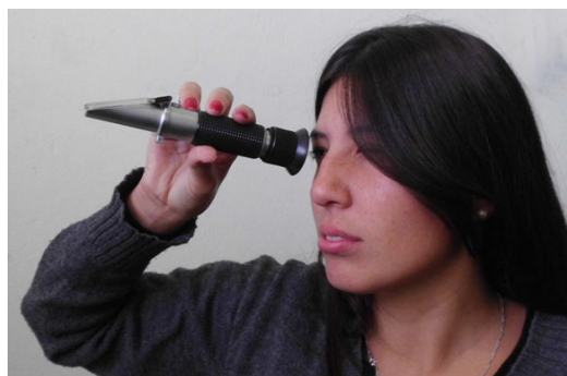
Personal del Observatorio realizando medición de Grados Brix mediante refractómetro.