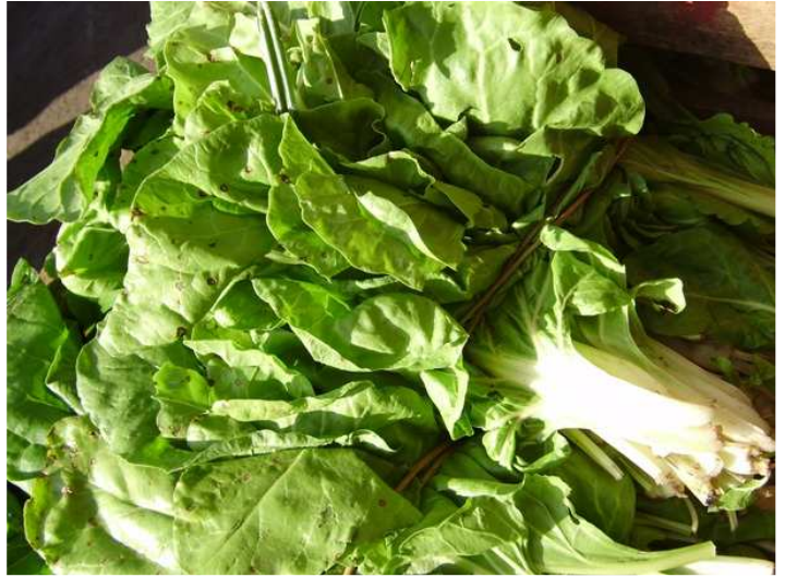
Atado de hojas de acelga de pequeño tamaño con daños causados por hongos y daños mecánicos