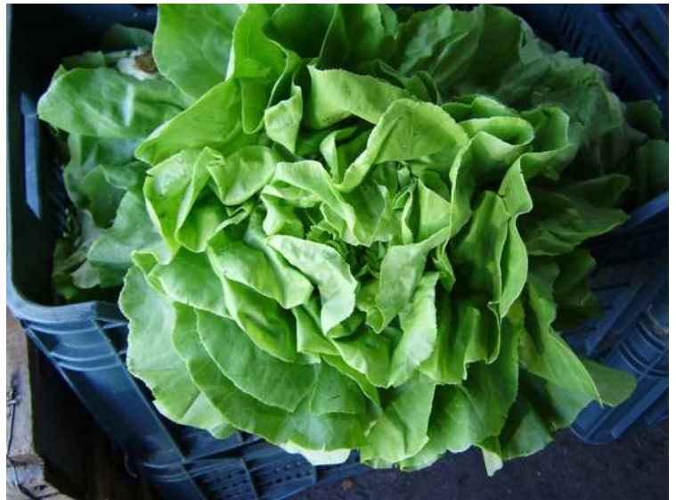
Planta de lechuga de pequeño tamaño pero sin problemas de calidad