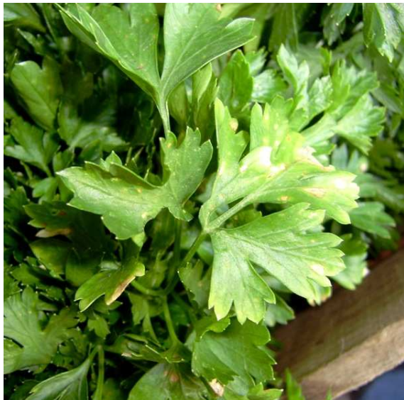
Detalla de hojas de perejil donde se observan daños causados por hongos