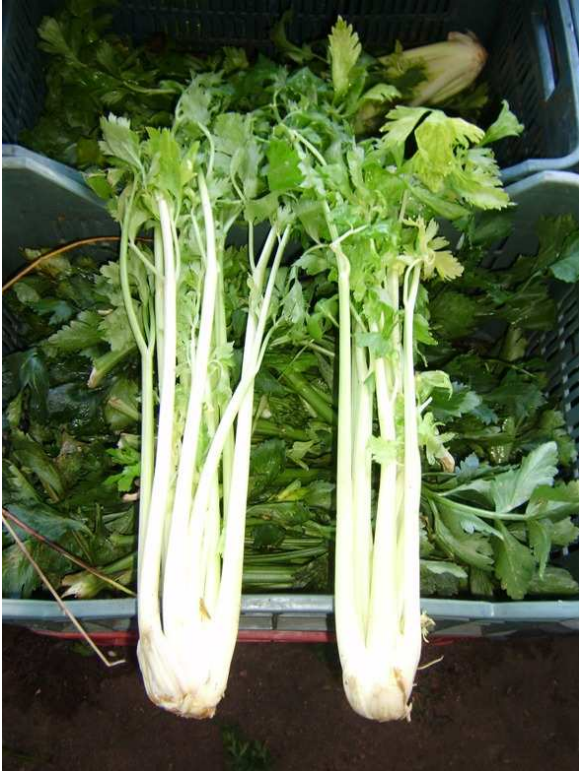
Unidades de apio planta mostrando problemas de calidad y pobre desarrollo