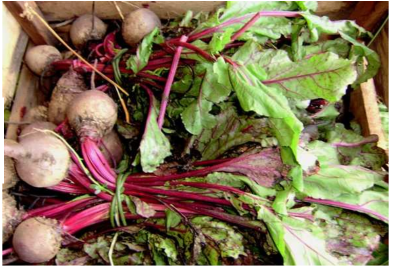
Atados de remolacha con mezcla de calibres y problemas de calidad en las hojas (daños mecánicos y hongos)