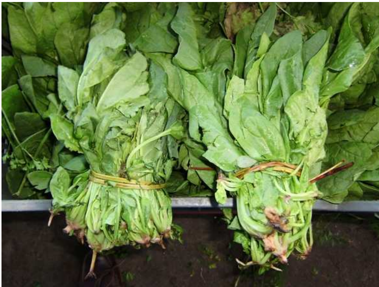
Atado de hojas de espinaca de pequeño tamaño con daños mecánicos