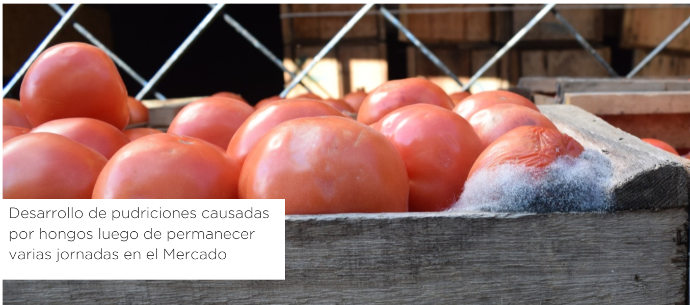
Desarrollo de pudriciones causadas por hongos luego de permanecer varias jornadas en el Mercado