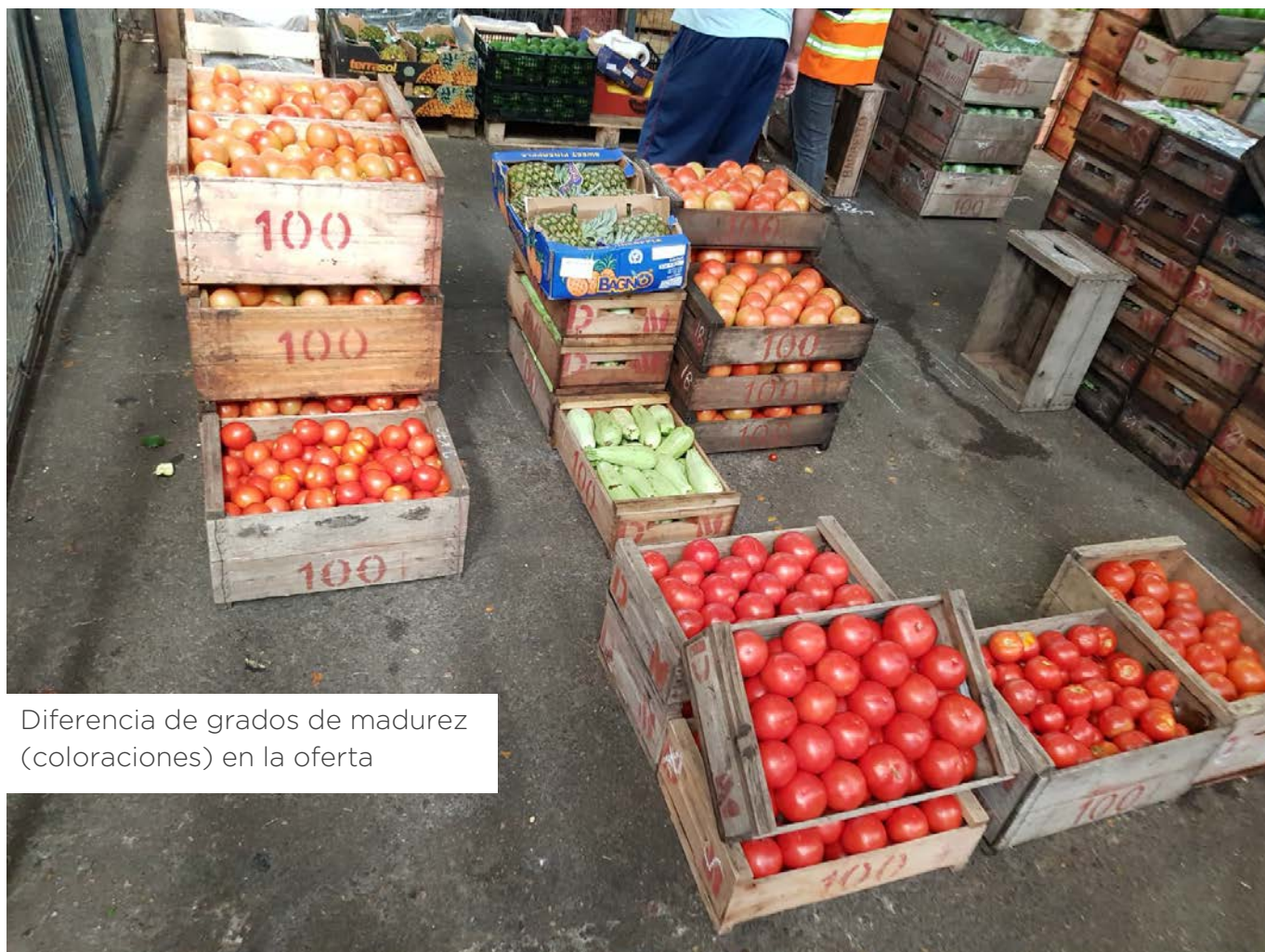
Diferencia de grados de madurez (coloraciones) en la oferta