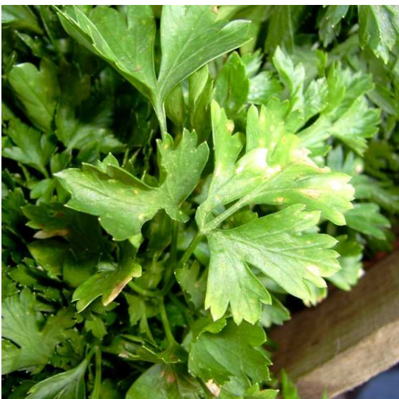
Detalla de hojas de perejil donde se observan daños causados por hongos