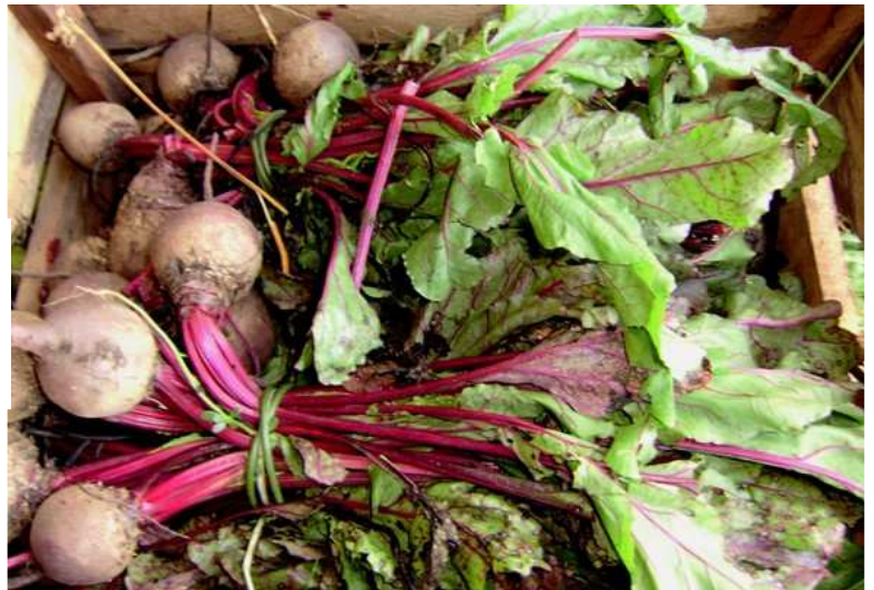
Atados de remolacha con mezcla de calibres y problemas de calidad en las hojas (daños mecánicos y hongos)