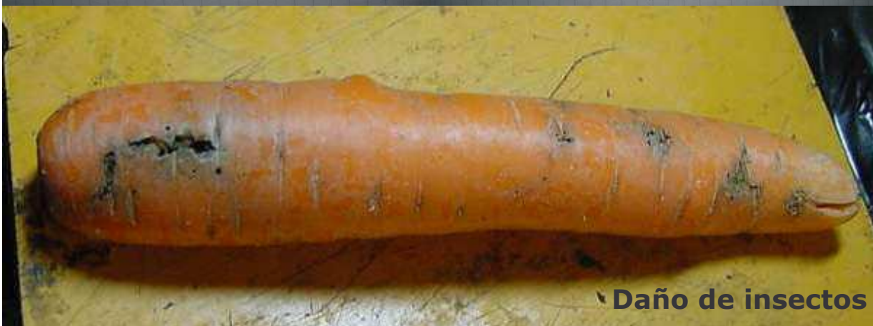
Daño de insectos